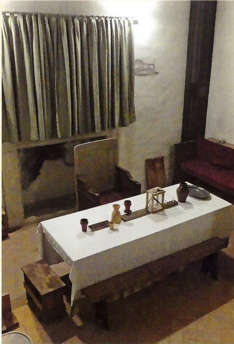
Secondo livello: Cenacolo (particolare)

Come era in uso nel Medioevo, tutti i piani delle torri non avevano accesso agli altri piani, per rendere meno vulnerabile il manufatto.