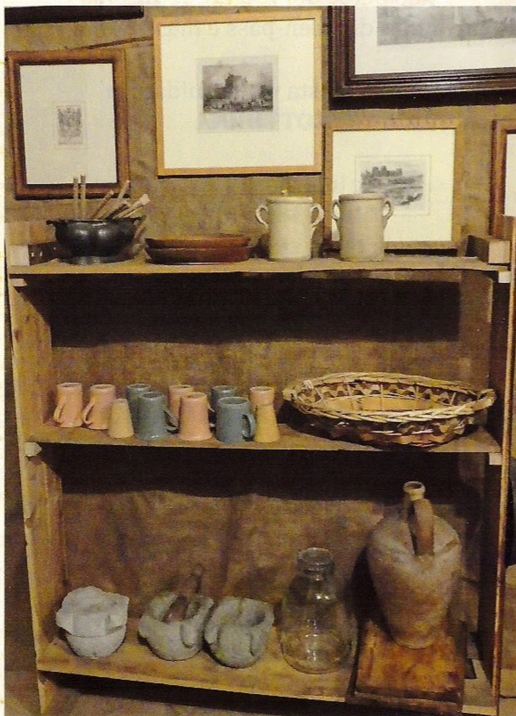
Secondo livello: Cenacolo (particolare)

La Corte Scaligera, ricca di ospiti illustri, tra i quali Dante Alighieri (per due volte), teatro della storia di Giulietta e Romeo, crocevia di comunicazione obbligato tra nord e sud, tra Impero e Papato, la vera culla di ciò che sarà il Rinascimento .