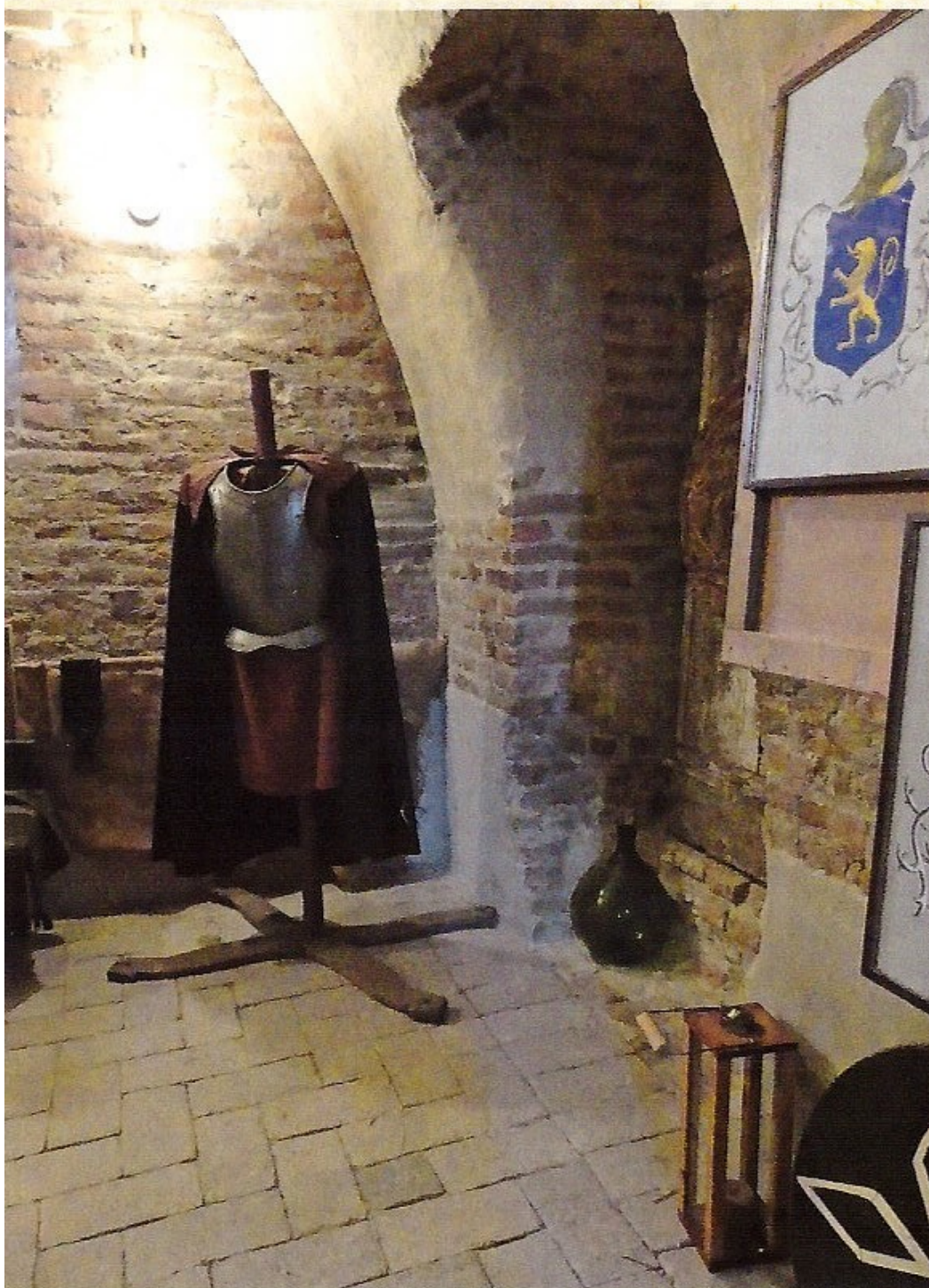
Primo livello: Corpo di Guardia (particolare)